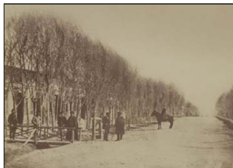
В русской части Ташкента. Фотография 1860-х годов